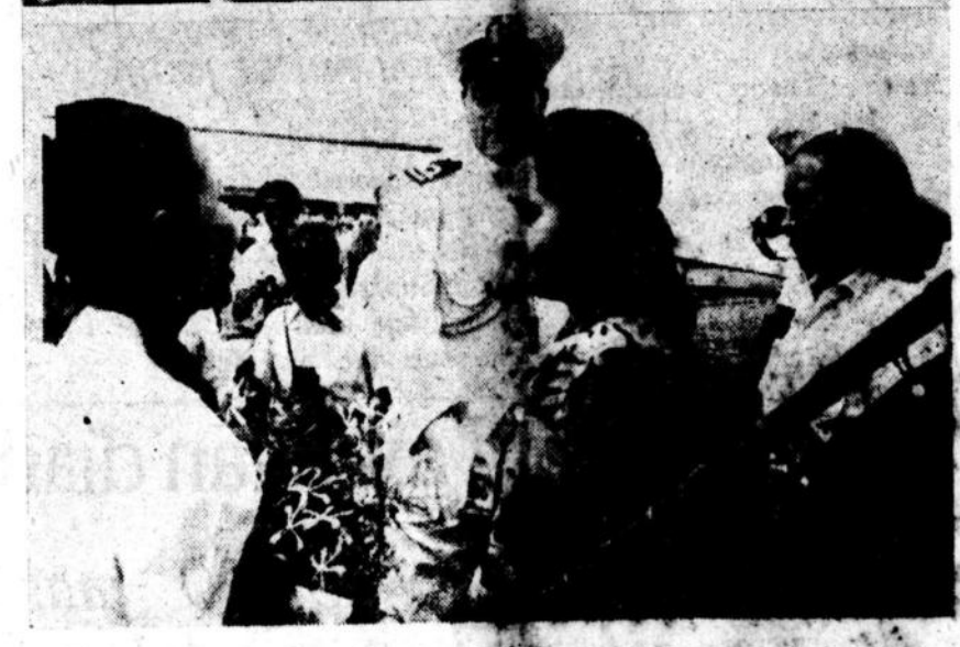
Drs. M. Hatta beserta Njonja, se tibanja dilapangan terbang Kemajoran (Djakarta) pada tgl. 14-11-1949.